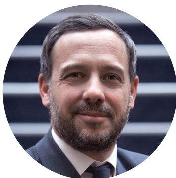
ADRIEN TAQUET Secrétaire d'État

Cette stratégie sera également un lieu de dialogue entre l'Etat et les départements. À rebours d'une vision rigide et datée des enjeux de répartition des compétences (et donc des financements), mon souhait est que nous puissions, de manière pragmatique, améliorer les pratiques et les modes de faire, pas à pas et de manière concrète, sur des sujets aussi essentiels que les délais d'exécution des mesures de justice, les déplacements multiples que subissent certains enfants, le suivi en santé, les impasses de la prise en charge du handicap et de la santé mentale en protection de l'enfance.